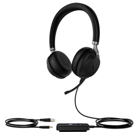
UH38 Dual Teams-BAT UH38 Dual UC-BAT

Das UH38 verfügt über ein hochwertiges und stabiles Design aus hochwertigem Kunststoff mit einer Metallverstärkung. Das hautfreundliche Material, weicher, ergonomisch geformter Memory-Schaumstoff, ist auch nach einem langen Arbeitstag sehr bequem.