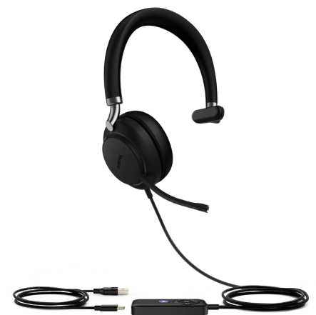
UH38 Mono Teams-W/O BAT UH38 Mono UC-W/O BAT